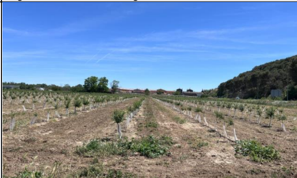
Imagen 4: Entorno