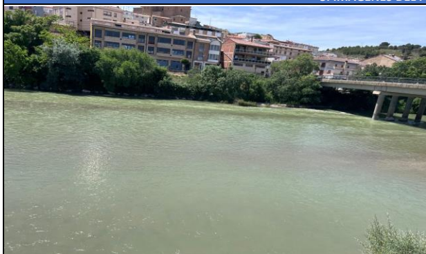
Imagen 1: Punto donde se toma la muestra