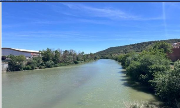
Imagen 2: Detalle de la masa de agua